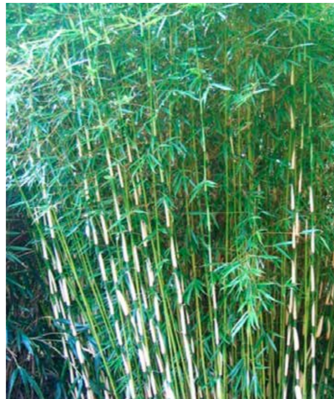
Fargesia rufa Pingwu