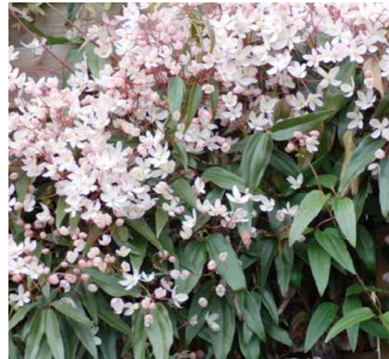
Clematis arandii «Apple blossom»