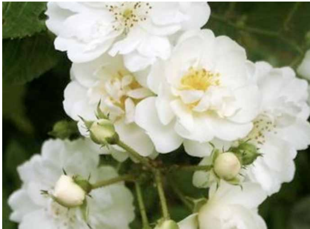
Rosa x grim pant «Guirlande d'amour»